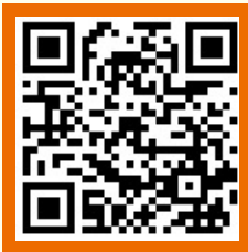
경기도평생교육이용권 누리집 QR코드