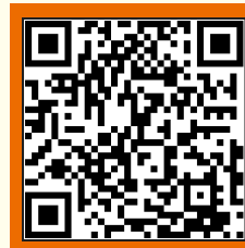
경기도평생교육이용권 사용기관 설명회 신청 QR코드