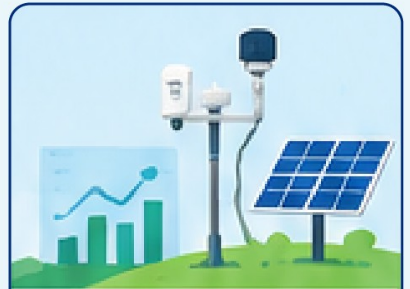
아두이노 기상 관측 시스템