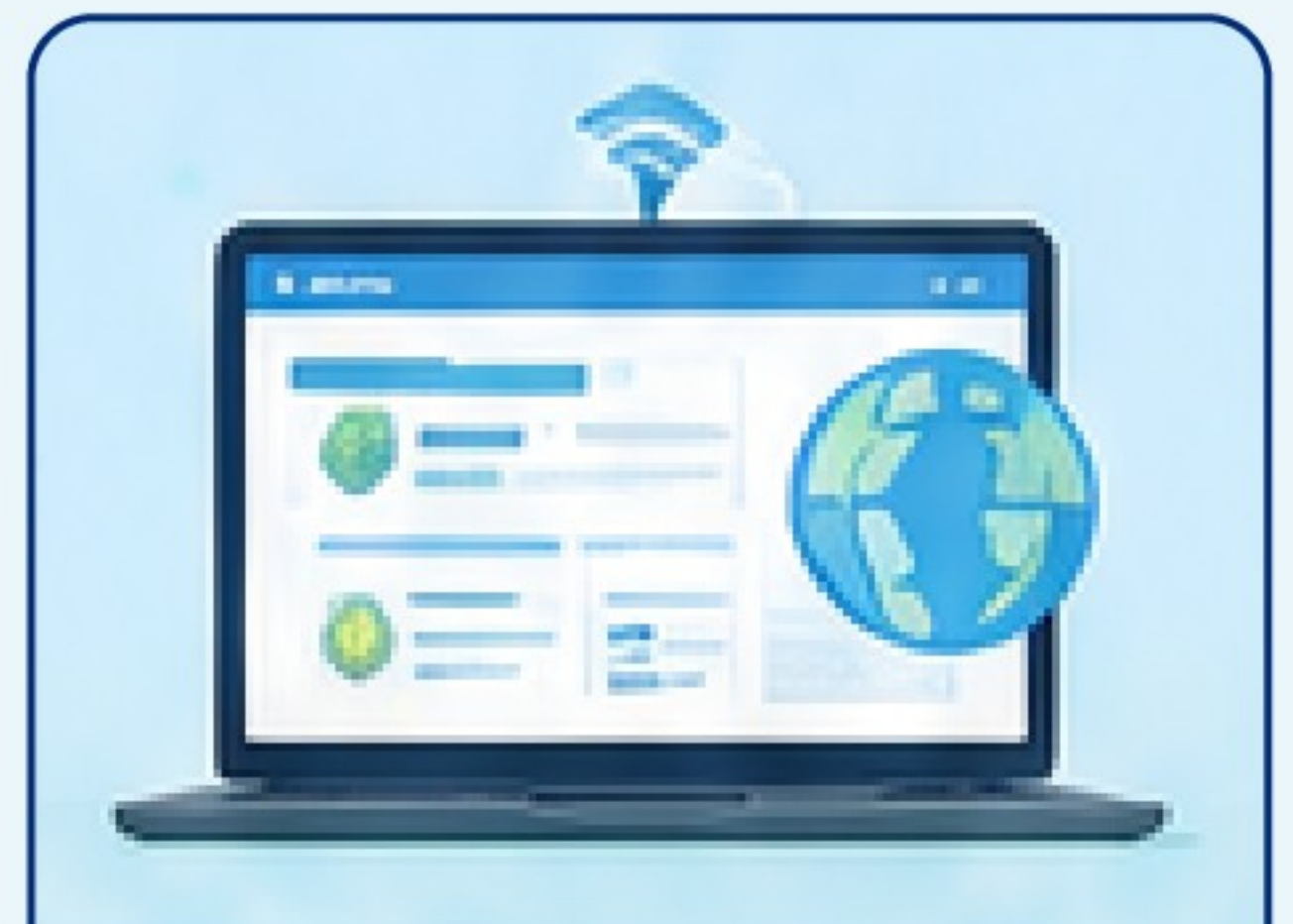
지속가능성 모니터링 플랫폼