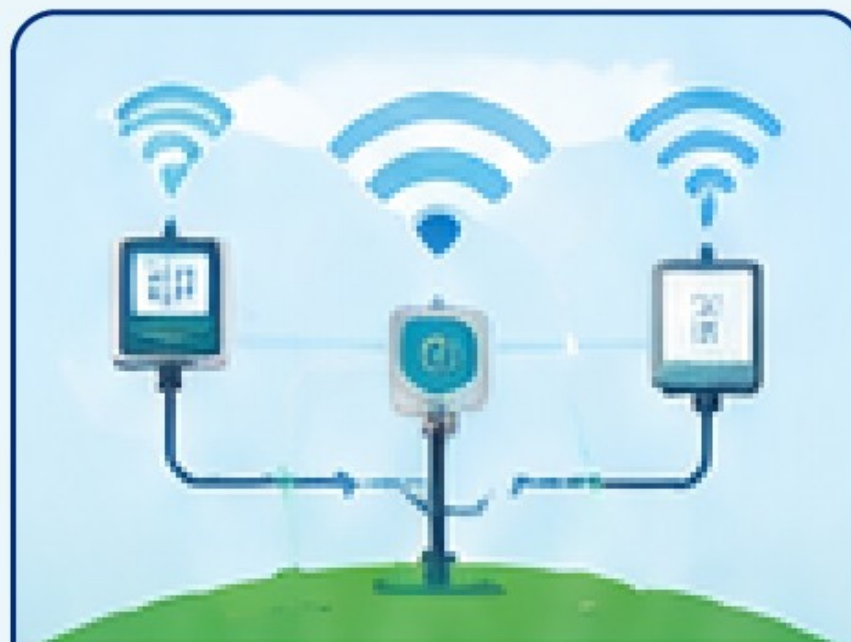
스마트 센서 시스템