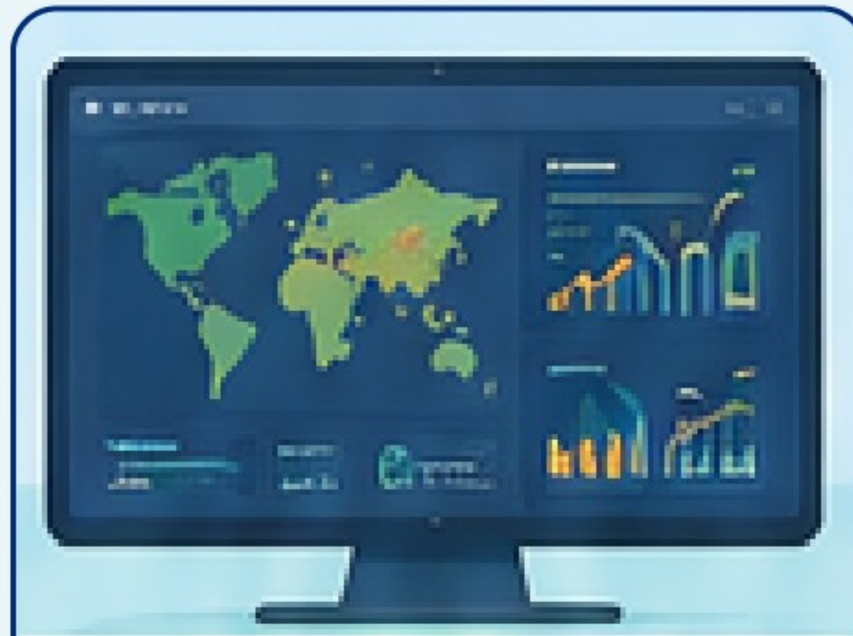
기후 데이터 대시보드