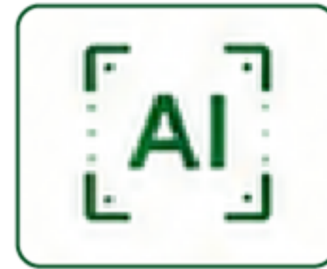
AI 이미지 분류